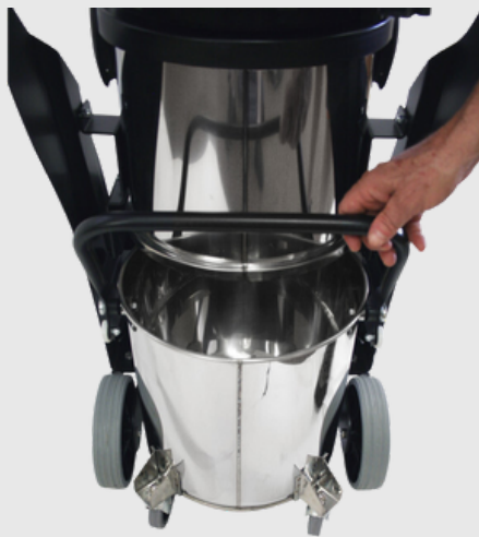
Auffangbehälter mit separaten Rollen