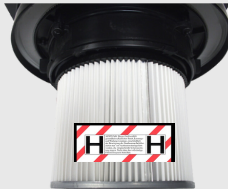
Auswaschbarer HEPA-Filter (H-Filter)