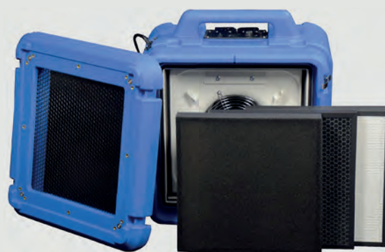
Abbildung mit optionalen Filtern